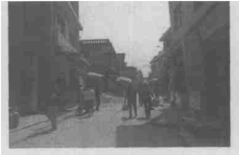
图 2 拥挤杂乱的道路