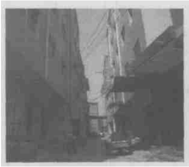
图 1 畸形建筑